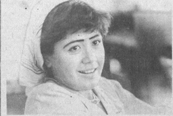
Прошел всего год, как консервный завод при общественном хозяйстве «Касасай» Касасайского района Наманганской области выдал первую продукцию. За это время значительно увеличилось производство продукции...