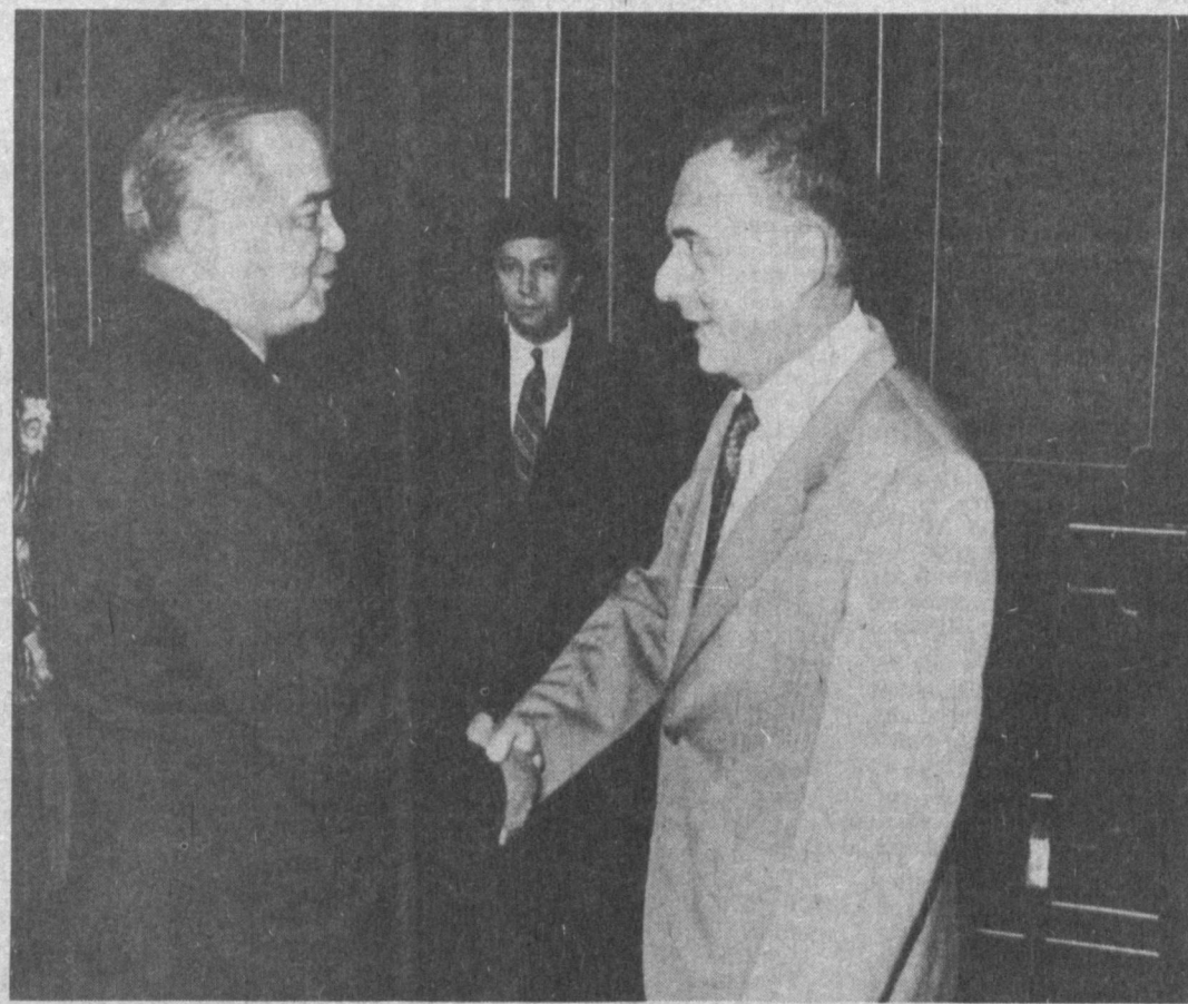
НА СНИМКЕ: во время приема.

Президент Республики Узбекистан Ислам Каримов 25 августа принял прибывшую в нашу страну с деловым визитом делегацию Российской Федерации во главе с министром иностранных дел Андреем Козыревым.