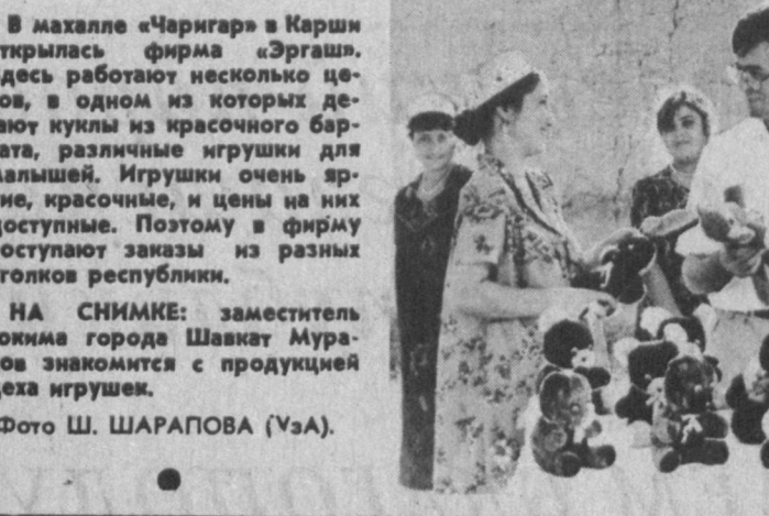
В махалле «Чаригар» в Карши открылась фирма «Эргаш». Здесь работают несколько цехов, в одном из которых делают игрушки из красного бархата, различные игрушки для малышей. Игрушки очень яркие, красочные, и цены на них доступные. Поэтому в фирму поступают заказы из разных уголков республики.