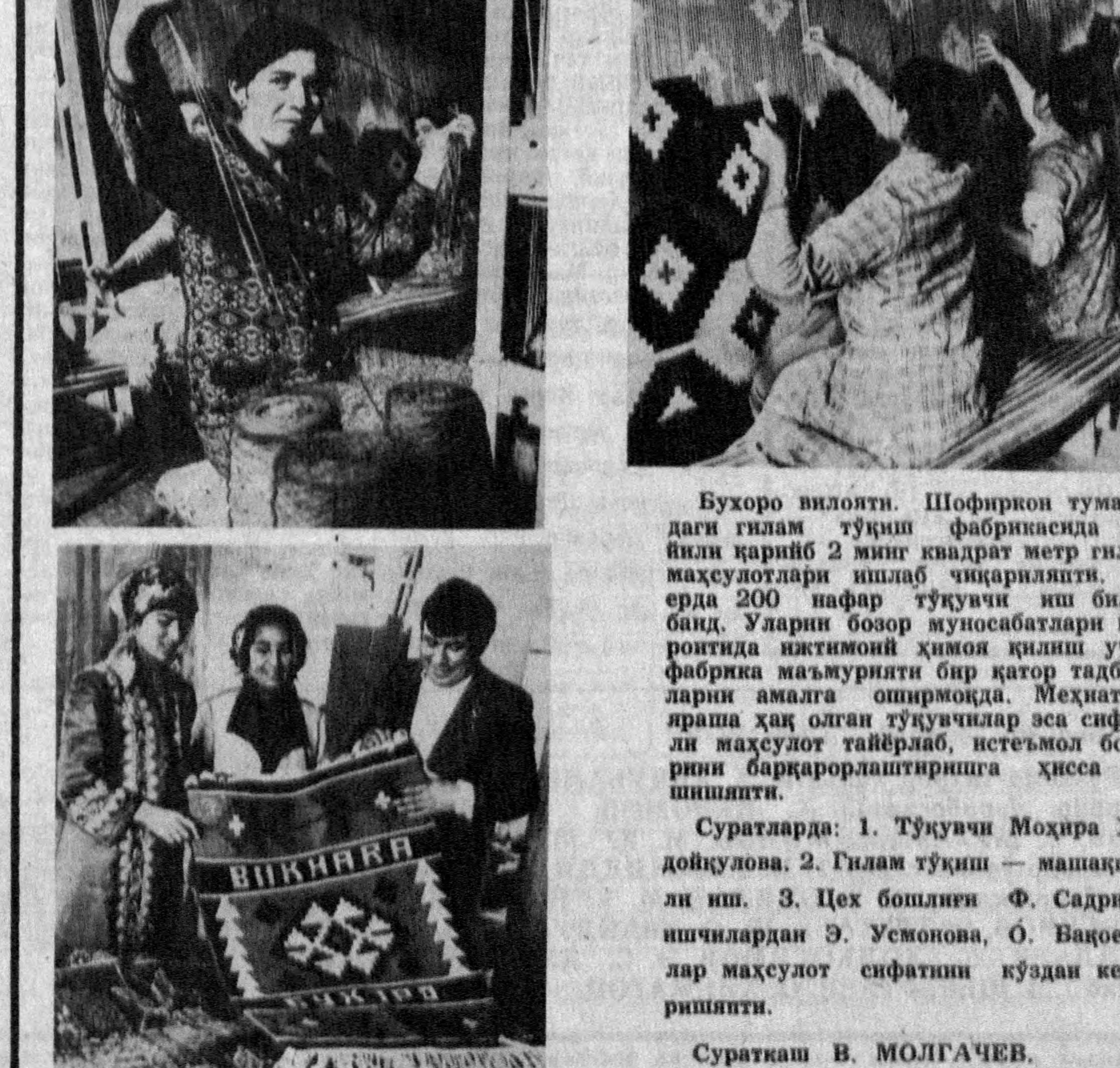
Бухоро вилояти. Шофиркон туманидаги гилам тўқиш фабрикасида ҳар йили қарийб 2 минг квадрат метр гилам маҳсулотлари ишлаб чиқариляпти. Бу ерда 200 нафар тўқувчи иш билан банд. Уларинг бозор муносабатлари партоқда иккинчи ҳилом қилиш учун фабрика маъмурияти бир қатор тадбирларни амалга оширмақда. Меҳнатга яраша ҳат олган тўқувчилар эса сифатли маҳсулот тайيارлаб, истеъмол боюрини барқарорлаштиришга ҳисса қўшиляпти.

Мингбулоқ нефтининг захираси ҳақида икки оғиз сўз. Бу кон саноят захираси ҳақида ҳали аниқ бир