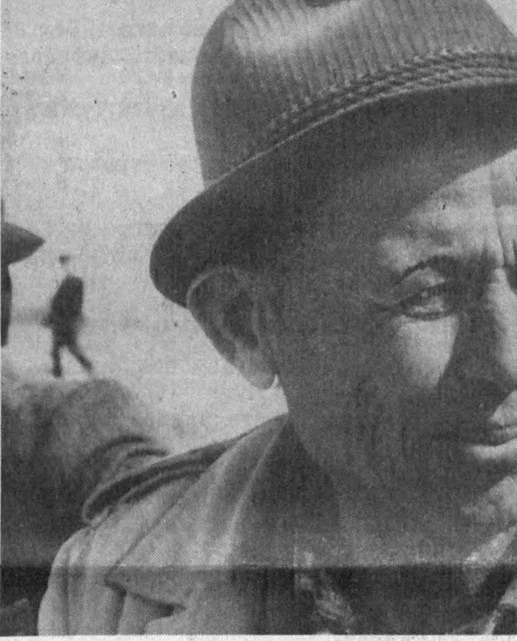
Элликқала райондаги «Қирққизобод» маммо хўжалиги аъзолари бу йил пахтадан мўл ҳосил йиғиштириб олишга ҳаракат қилмоқдалар.