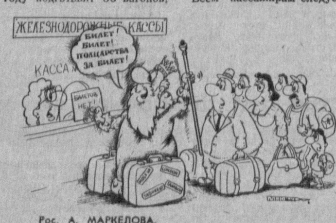
ЖЕЛЕЗНОДОРОЖНЫЕ КАССЫ ВНЕДРЯЮТ СИСТЕМУ «ЭКСПРЕСС» ЗА БИЛЕТЫ. Рис. А. МАРКЕЛОВА.

Символично, что два дружественных народа — узбекский и индийский на стыке лет и осени празднуют День независимости. Символично и то, что в Индии в знаменательный день государственной стаг первым делом поднимают над Красным фортом — районом Дели, который построил индус нашего великого земляка Захриддина Бабура Шах Джахан. Чрезвычайный и Полномочный Посол Республики Индия в Узбекистане Д. МЕХТА для интервью обозревателю «Правды Востока».