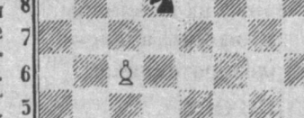
Белые начинают и делают ничью.