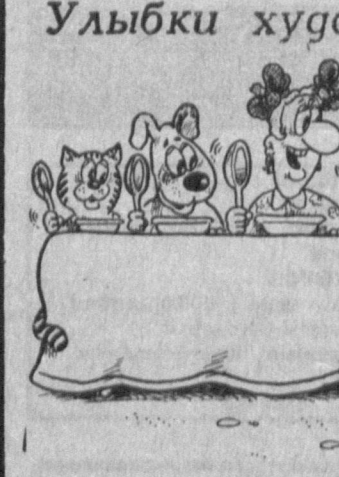
Рис. А. МАРКЕЛОВА.