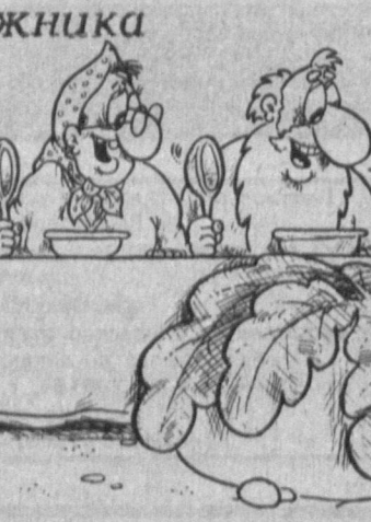
Рис. А. МАРКЕЛОВА.