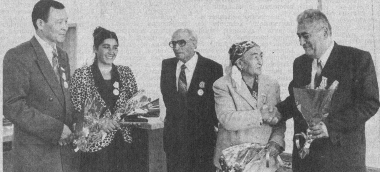
НА СНИМКАХ: во время вручения высоких наград.