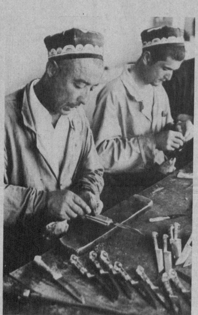
НАМАНГАНСКАЯ ОБЛАСТЬ. Чуст славится своими на- родными умельцами, особенно мастерами по изготовлению но- жей. Чустские ножи известны далеко за пределами нашей страны. В настоящее время чустские мастера заняты изготовлением 18 видов национальных и 5 видов хозяйственных ножей. На снимке: в Чустской мастерской по изготовлению но- жей.

Словом, постепенно соз- дается необходимая инфра- структура ценных бумаг. Т. НИЗАЕВ.