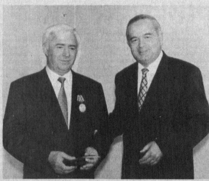
НА СНИМКЕ: во время вручения.

Н. АБУЛЛАЕВ. Соб. корр. «Правды Востока». Наманганская область.