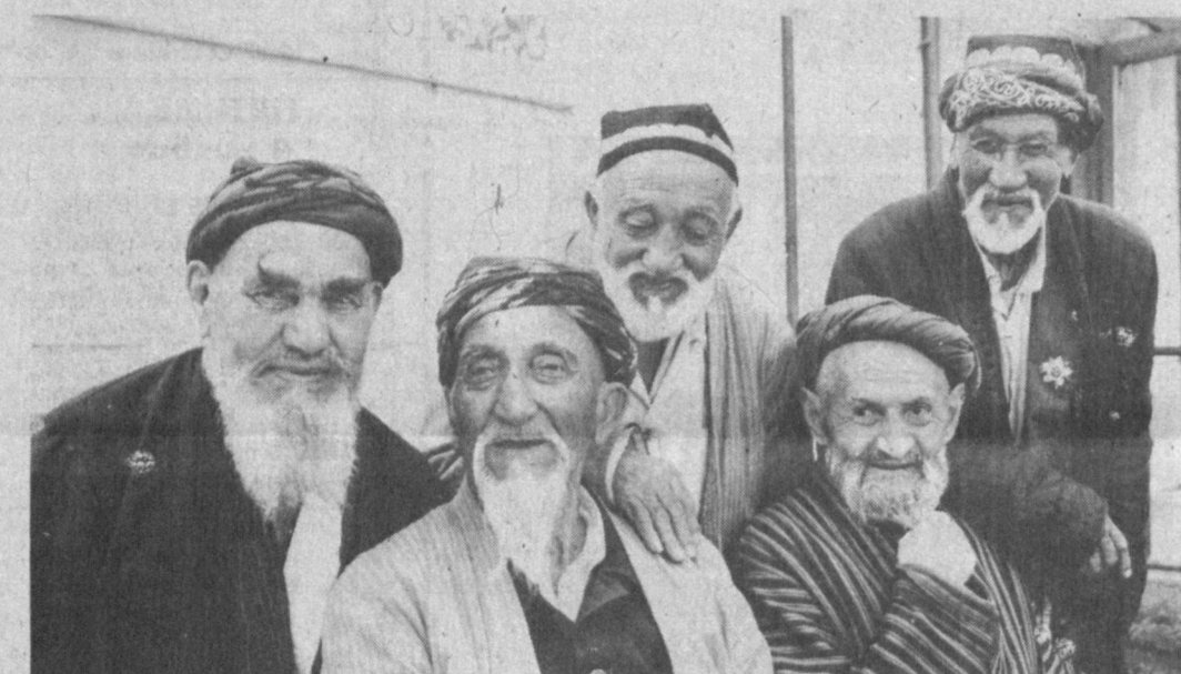
Есть еще порохо...

бурчмудлинскому инспектору, не нашел ил отпариться... Сейчас Узбекистан, обрета независимость, усилил охрану своих природных богатств. Но только Чаткальский заповедник имевший прежде союзное значение, но и территории нескольких лесхозов, площади высокогорного Бостанлыкского и соседних районов вошли в громадный национальный парк. Пройдет, однако, время, прежде чем в режиме этого парка привыкнут, разберутся, где все можно, где не