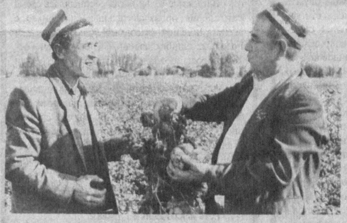
Ходжабады всегда стремился с пользой использовать каждый клочок земли.

Известно, здоровое семя - это крепкое племя. Поэтому государство за высококачественный семенной материал оплачивает вдвое выше.