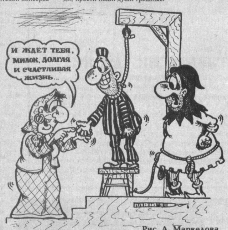
Рис. А. Маркелова.

тории установлен первый в Средней Азии орган, переданный в подарок Узбекистану правительством Украинской ССР. Правы были древние, когда говорили: жизнь коротка, искусство вечно - советской Украины нет, но музыка звучит. 23 ноября 1820 года в итальянском городке Кастель-Гандольфо был установлен первый почтовый ящик. А в 1927 году Самуил Маршак придумал "Почту" с ленинградским почтальоном с толстой сумкой на ремне, с цифрой 5 на медной бляшке, в синей форменной фуражке. 20 ноября 1928 года в Узбекистане открылся первый республиканский съезд безбожников. Господи, прости наши души грешные!