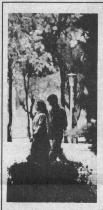
В осеннем парке. Фото Леонида Гусейнова.