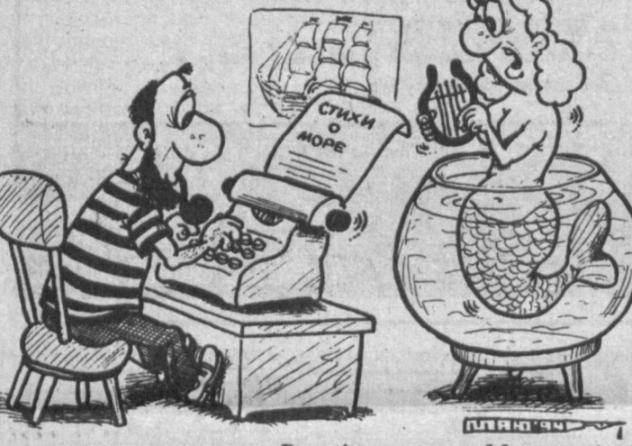
Рис. Александра Маркелова.