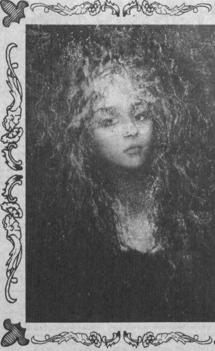
ВЗГЛЯД. Художника и фотографа.

РЫБЫ (19.02 - 20.03). Радостные новости ожидают Рыб в понедельник и воскресенье. Астролог надеется, что вы сможете в полной мере воспользоваться благоприятными возможностями этого периода. Романтическая встреча в среду может вылиться в горячее разочарование на следующий же день. В субботу не исключен поход в стоматологическую поликлинику.