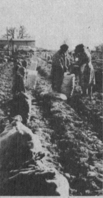
В коллективном хозяйстве им. Ходжи Исмаила ал-Бухори Чекатского района Самаркандской области в нынешнем году с 90 гектаров собран неплохой урожай картофеля.