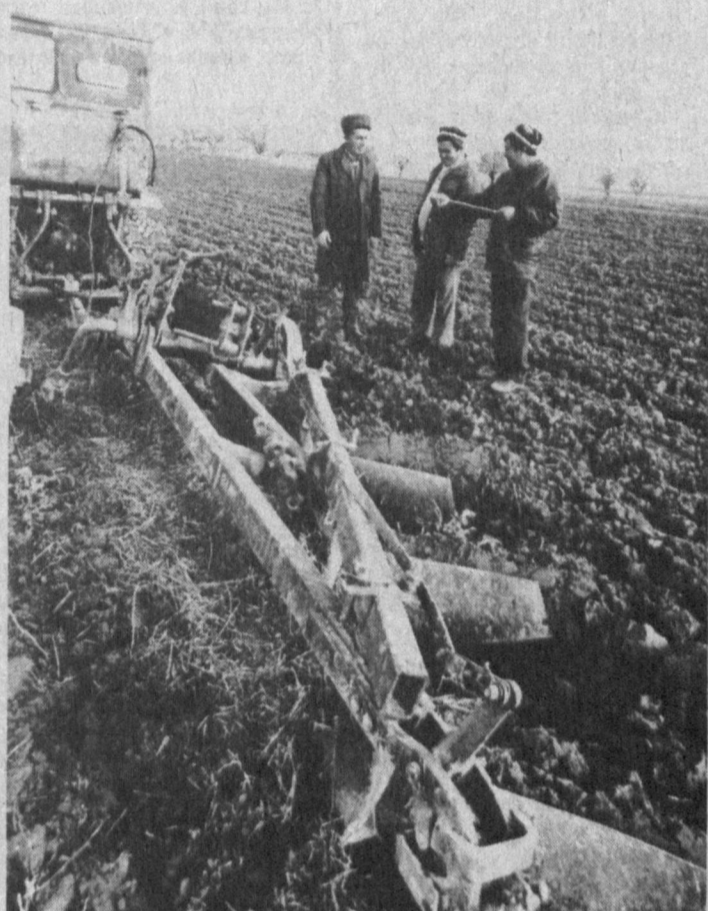
С пользой стараются использовать каждый клочок земли дехкане Иштыганского района. Годовой план хлопкозаготовки здесь перевыполнен - получено 34 тысячи тонн сырья.

Продолжается подписка на старшую и Центральную газету "Правда Востока".