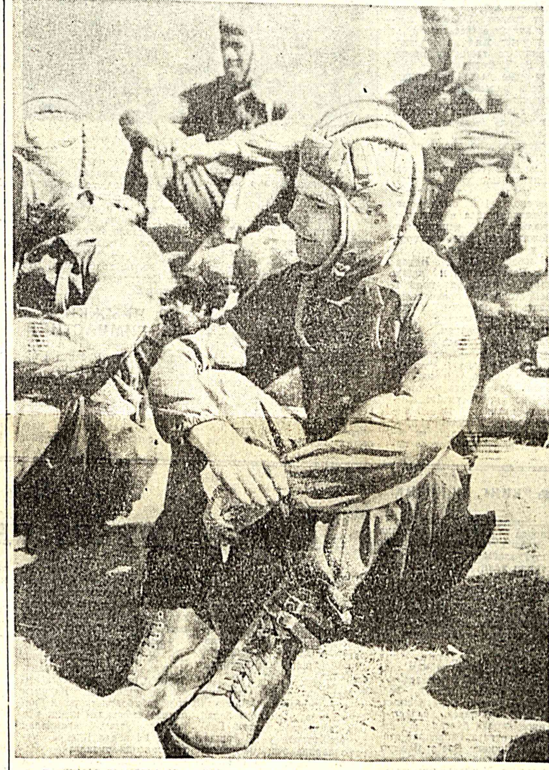
За несколько минут до старта.