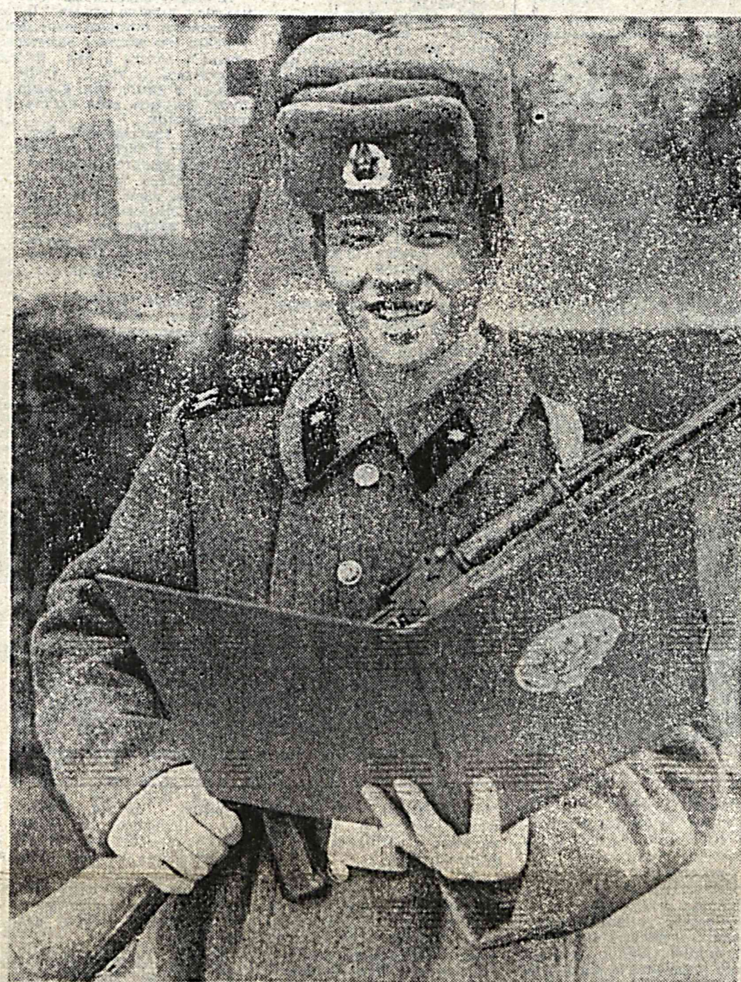
Жожаков Узбекистоннинг турли истиқболли учун унинг давлат манфаатлари ва мустақиллигини химоячиси бўлишга қасамед қиламан.