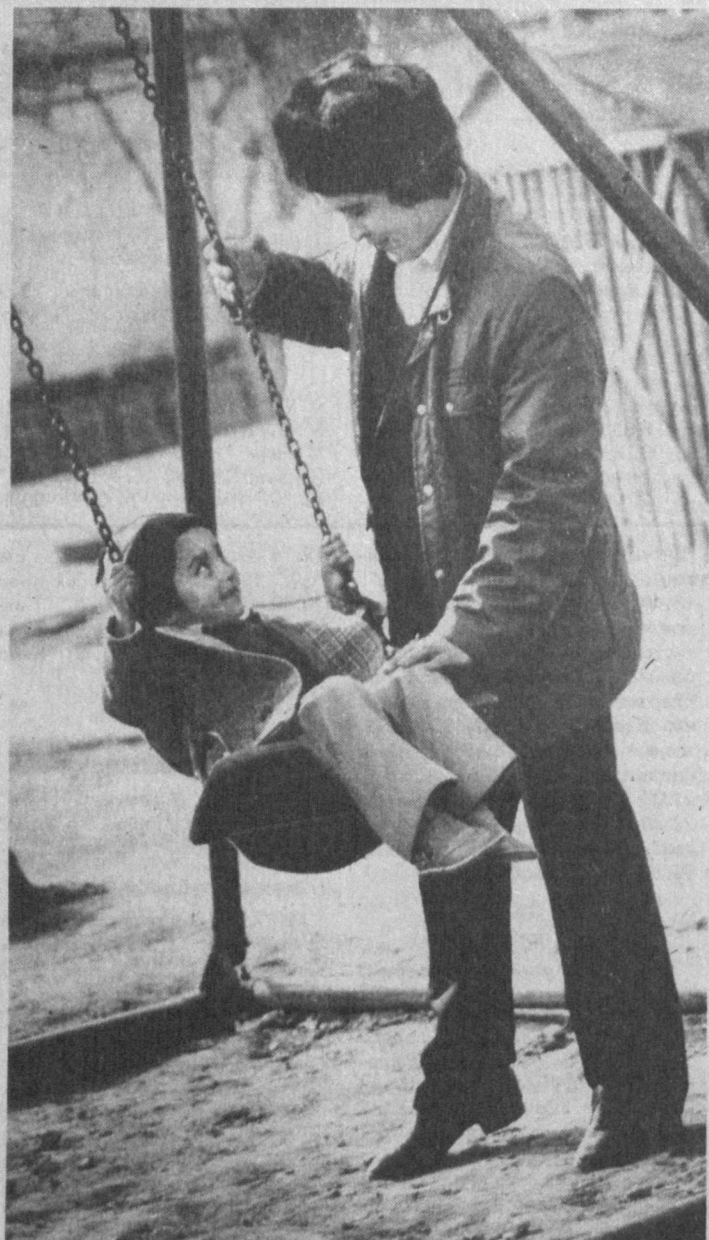
Когда рядом папа...

РЫБЫ (19.02 - 20.03). Неделя будет насыщена мелкими делами и заботами. В понедельник и среду возможны перебранки с домочадцами, мелкие конфликты на работе. Четверг благоприятен для приобретения мебели и бытовой техники, а суббота - для интеллектуальных занятий и творческих начинаний.