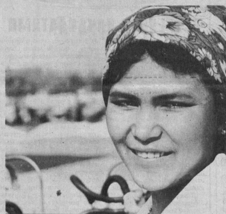
На животноводческой ферме союза кооператоров имени Манноба Джадалова Бозского района Андиканьской области большое внимание уделяется обеспечению населения мясо-молочными продуктами. В настоящее время на ферме содержится 1054 головы крупного рогатого скота, из них 381 - дойные коровы. Животноводы планируют в этом году сдать 877 тонн молока, 103 тонны мяса.

Проблемы жилищно-коммунального хозяйства давно стали "вечной" темой. Государство обрекает на независимость, граждане - права на жилище. Но став полноправными владельцами своего жилья, по-прежнему обивают пороги разных контор в поисках своих конституционных прав на благоустроенное жилье. Не первый год пишут члелбитные жители дома №67 по улице Бабура Ташкента. Все службы 700-квартирного дома, сланного в эксплуатацию в начале 80-х годов, работают неважно. Протекает крыша, эпизодически отключается подача горячей и холодной воды, неважно работает отопление, замершие лифты, засоренный мусоропровод - и еще десятков других больших и малых жилищно-коммунальных "неудобств". На жалобы и обращения работники ремонтно-эксплуатационного управления №2 Яккасарайского района предпочитают не реагировать. Опыт долгий и упорной борьбы жилищхозовцев из РЭУ-2 с жильцами дома №67 научил тех и других секретам открытого и тайного противостояния. Холодной воды, говорят, нет в восьмом корпусе? И не будет. Все мастера на зваяках.