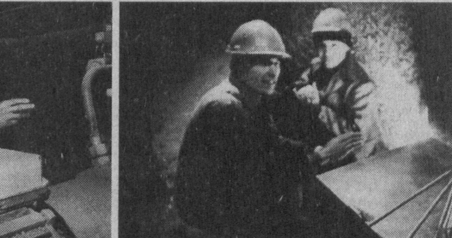
В Бекабде нынче зима особенная. И снега много, и ветрено очень. Оттого и морозец кажется жалищим. Не чувствуется холода лишь за стенами акционерно-производственного объединения "Узметкомбинат". Здесь по-прежнему без остановки варят сталь, делают так нужную для республики продукцию и ведут одновременно гигантскую реконструкцию, о чем "Правда Востока" расскажет чуть позже.