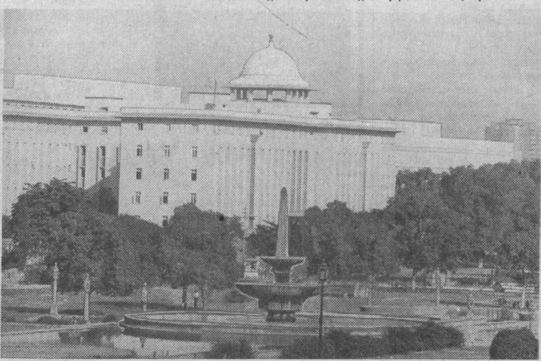
НА СНИМКЕ: внизу - уже Азия, Индия. Это - Дели, также город, любимый туристами со всех континентов. Такие административные здания украшают его центр.