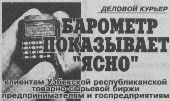
клиентам Узбекской республиканской товарно-сырьевой биржи предпринимателям и госпредприятиям

обихода. Общие технические условия его предусматривают, в частности, что после химчистки ваша одежда должна "сохранить исходную форму, целостность, размеры, цвет, рисунок и рельефность". Именно это и добивается немногочисленный коллектив арендного предприятия, что расположено в центре города, у "Детского мира". Здесь одним из первых в городе добились рентабельности своего производства за счет качества обработки изделий, сокращения сроков выполнения заказов (через три часа, если хотите, или через сутки вы можете получить свою одежду), приобретения запчастей и деталей для машин, ремонта двигателей на предприятиях Ташкента. Здесь рационально используют сырье, электроэнергию, воду. Своими силами проводят профилактические осмотры и текущий ремонт техники, сложного электрооборудования. Тут незаменимы мастера на все руки - и электрик и слесарь - Науфаль Хакимов. Были случаи, когда из-за прекращения подачи электроэнергии простаивали днем, но тогда коллектив безропотно работал ночью, но заказы клиентов всегда выполнялись в срок. Здесь не привыкли и ходить в джинсах. В общем, приходите. Жалеть не будет. Как и в театре, на хорошую премьеру. Борис Палацкий. Корр. "Правды Востока".