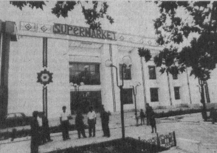
Самаркандский универмаг "Фархад и Ширин" пользуется большой популярностью. Здесь широкий ассортимент товаров. Часть из них выпускает сам коллектив универмага. В частности, при нем открыта минипечка, которая в месяц выдает до десяти тонн хлебобулочных изделий. Продукция швейного цеха пополняет товароборот на 600 - 650 тысяч сумов.

Недавно при универмаге открыли супермаркет. В нем в основном реализуются зарубежные товары, завозимые из Израиля, Швеции, Германии и Турции.