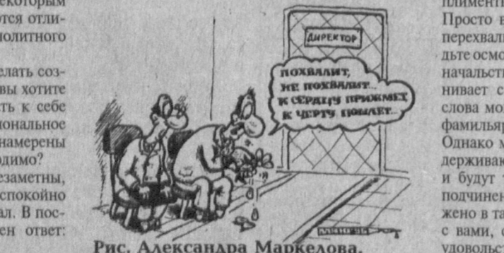
Рис. Александра Маркелова.

тех, кого мы хвалим, такие недостатки, на которые мы не решились бы указать прямо. Лесть в перемешку с критикой - явление достаточно распространенное в наши дни. Что поделяет: многим даже такая похвала кажется предпочтительнее полезных замечаний. Возмущенный коллега, сделавший неоднозначный комплимент, хотел уклониться от явной критики из лучших побуждений. В случае сомнений можно попросить его выразиться яснее.