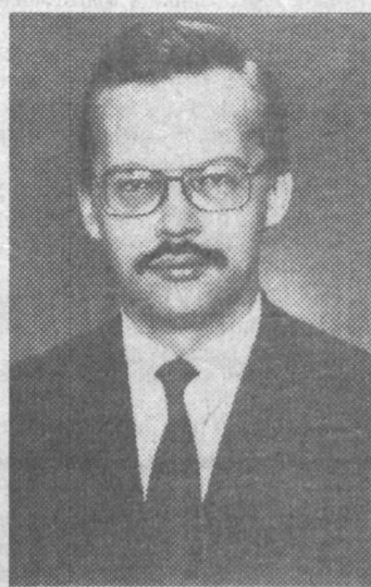
Чрезвычайный и Полномочный Посол Латвии в Узбекистане Андрис Вилцанс

Чрезвычайный и Полномочный Посол Латвии в Узбекистане Андрис Вилцанс считает, что сейчас есть все возможности для кардинального развития новых экономических связей между нашими государствами - не забывая о положительном опыте прошлого и руководствуясь искренней обоюдной заинтересованностью.