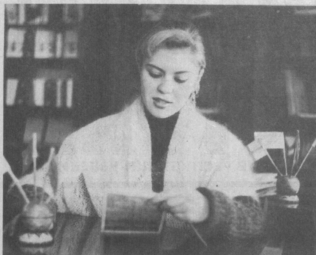
Романо-германский факультет Наманганского государственного университета расширяется из года в год. В прошлом году дополнительно к немецкому и английскому отделениям здесь открылись и французское. Число поступивших студентов увеличилось в этом году до 70 человек. Факультет поддерживает тесные связи со многими зарубежными посольствами, с их помощью здесь собрана богатая факультетская библиотека. Ряд студентов и преподавателей совершенствуют свои знания в зарубежных странах. На факультете создана специальная группа по подготовке переводчиков-референтов, в ней занимается 15 самых успевающих студентов. Кроме того, 20 отличников обучаются на курсах по подготовке гидов-переводчиков. НА СНИМКЕ: на романо-германском факультете обучаются юности и девушки семи национальностей - русская студентка 3-го курса отделения английской языка Александра Бухеева.