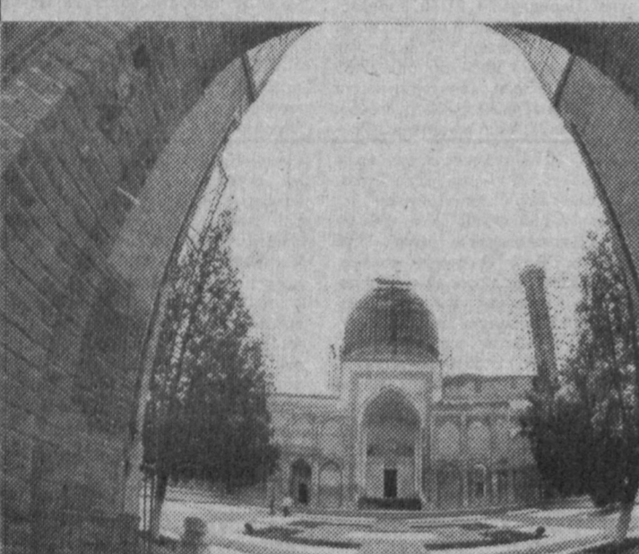
В Самарканде начались реставрационные работы одного из древнейших исторических памятников города - "Тури Амир".

Год Амира Темура. В Самарканде начались реставрационные работы одного из древнейших исторических памятников города - "Тури Амир".