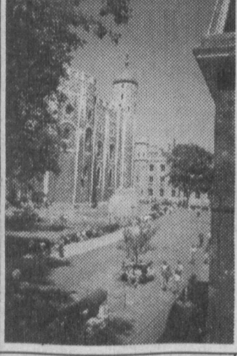
ИЗ БЛОКНОТА ЖУРНАЛИСТА

А в самом деле языковых проблем не было, но и полного взаимопонимания не возникло. "А не потеряли вы в творчестве, уйдя в бизнес?" Он сказал, что пишет пресс-релизы и иногда статьи в газете: "Нет, не потерял". А через паузу посоветовал сходить в мюзик-холл, куда недавно вошел партнер из Самарканда. Мы