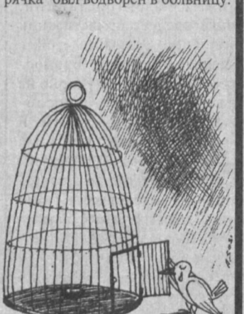
Рис. Александра Соседова.