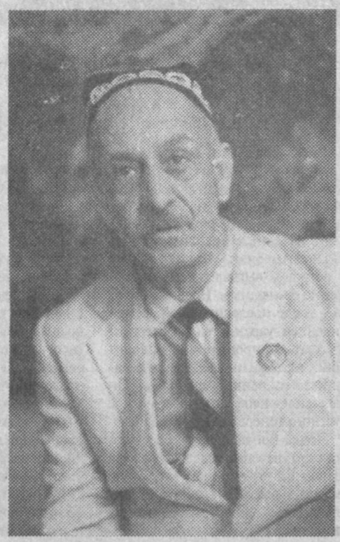
А когда уже перевалило Мне за сорок - непонятно было.

Пожой я был на Джека Лондона, а несколько позднее На другого человека - На Есенина Сергея.