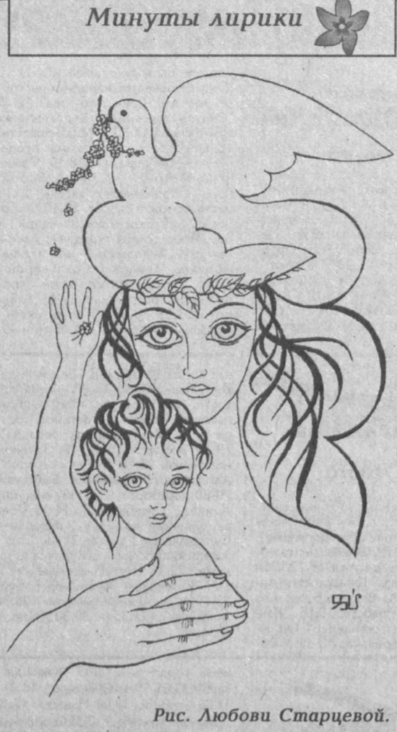
Рис. Любови Старцевой.

Чистое небо, Кусочек хлеба, Осень с дождями, Ночь со стихами.