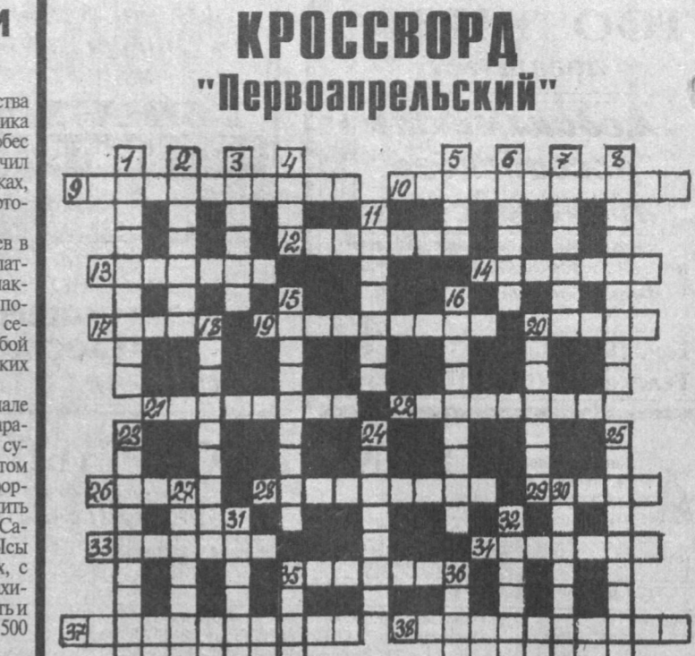
Составил Николай Бахтияров