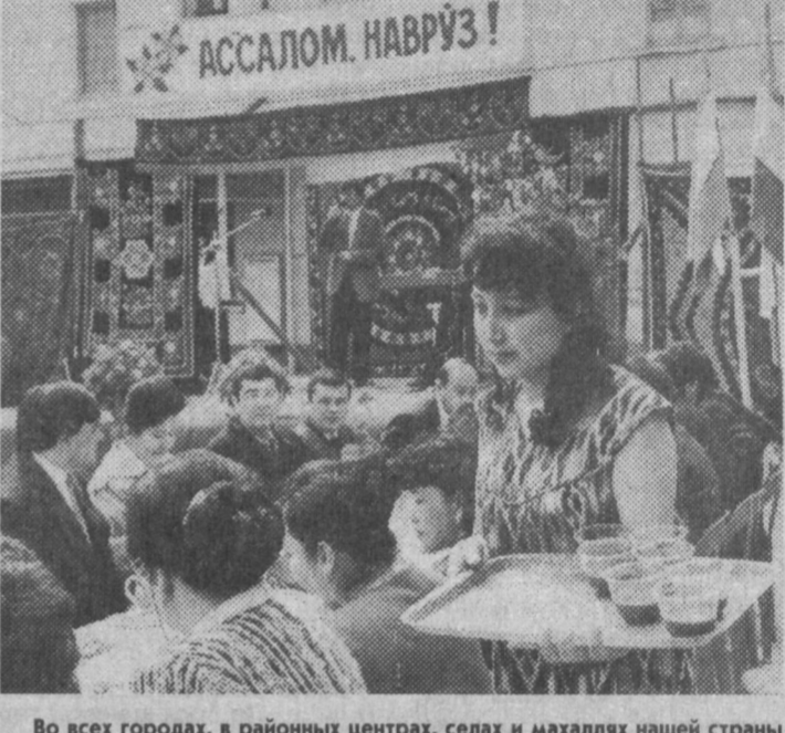
Во всех городах, в районных центрах, селах и махаллях нашей страны продолжается прекрасный весенний праздник - Навруз. Известно, что медицинским работникам хватает дел и в праздники, и в будни. Потому и собралась медпери первой городской клинической больницы имени Абу Али Ибн Сино за праздничным дастарханом чуть позднее. Коллеги и персонал клиники самых разных национальностей, возрастов и рангов - сердечно поздравили друг друга с праздником.

Доверие махаллинцев надо было оправдать. Ведь Илгор с двенадцатитысячным населением - это городок в городе. Представители двадцати двух национальностей живут здесь дружно. Накануне праздника Навруз махаллинцы провели субботник. Чистили арыки, сажали деревья, ремонтировали здание махаллинского комитета, а затем за торжественным праздничным дастарханом собрались единой семьей. Пятидесятые се-