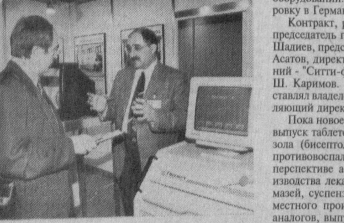
НА СНИМКАХ: у стендов выставки.

ХРОНИКА Указом Президента Республики Узбекистан Э. К. Хайитбаев освобожден от обязанностей министра по делам культуры в связи с уходом на пенсию.