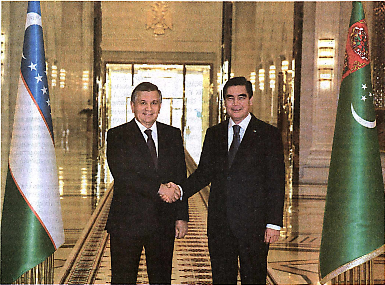
Как сообщалось ранее, Президент Республики Узбекистан Шавкат Мирзиёев по приглашению Президента Туркменистана Гурбангулы Бердымухамедова 17 сентября 2017 года совершил визит в Туркменистан.

Состоялась встреча Президента Узбекистана Шавката Мирзиёева и Президента Туркменистана Гурбангулы Бердымухамедова. В ходе искренней беседы отмечалось, что в последнее время отношения между нашими странами динамично развиваются во всех сферах. Важную роль в этом играют тесная дружба, доверие и искренность, установившиеся между главами двух государств.