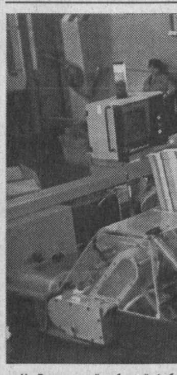
На таджикской табачной фабрике, входящей в состав совместного предприятия "УЗБАТ АО", идет реконструкция. При этом на минуту прекращается производство сигарет.

Асатилло Кудратов. Соб. корр. "Правды Востока".