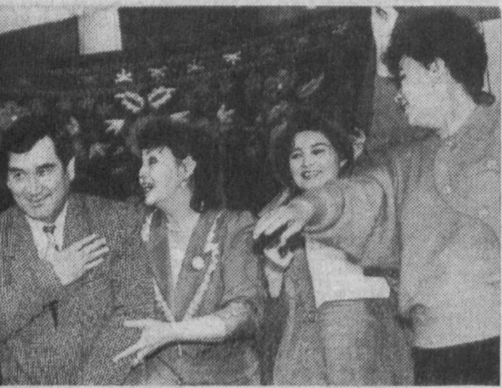
В концертных залах МИР ВЫСОКОЙ ДУХОВНОСТИ

Но тем и отличаются спектакли, поставленные театром танца Севастьяновой: они меняются в зависимости от состава исполнителей. Уехал Дилье - не стало той "Тайны".