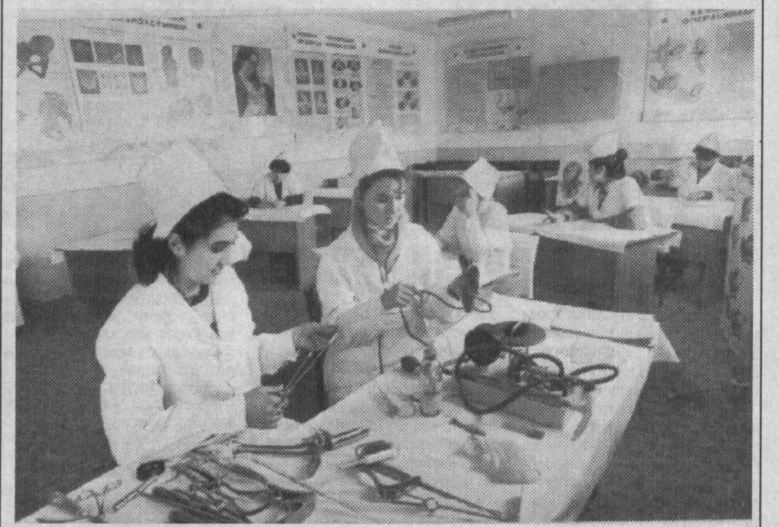
Самаркандское медицинское училище, которое считается одним из старейших в республике, скоро будет отмечать свое 70-летие. Училище подготовило 27 тысяч юношей и девушек. Сейчас здесь занимаются более 2300 учащихся. Они осваивают специальности акушера-гинеколога, зубной техника, санитаря, фельдшера. В училище