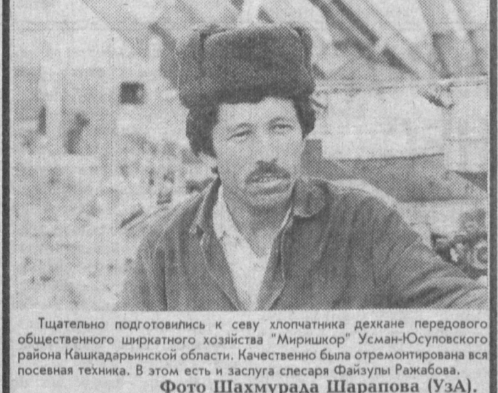
Тщательно подготовились к севу хлопчатника дехкане передового общественного ширкатного хозяйства "Миришкор" Усман-Осуповского района Кашкардарьинской области.

Юрий Генцке. Соб. корр. "Правды Востока". Ферганская область.