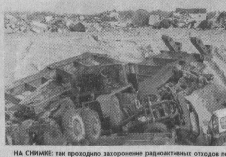
НА СНИМКЕ: так проходило захоронение радиоактивных отходов после аварии.