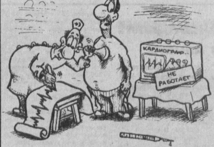
Рис. Александра Маркелова.

В последнее время получалось так, что матчи проводились как бы только ради голов и очков. Ради результата. Выпал болельщик. Мало кто о нем заболел.