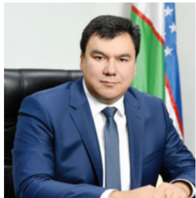
Азиз АБДУРАХИМОВ, Бош вазир ўринбосари, Туризмни ривожлантириш давлат кўмитаси раиси:

Видеоселектор йиғилишида эришилган натижалар билан бир қаторда ҳали ишга солинмаган имкониятлар кўплиги таъкидланиб, келгусидаги устувор вазифалар белгиланди. Ҳукумат вакиллари, тегишли кўмита ва маҳаллий ҳокимликлар мутасаддилари бу йўналишда белгиланган вазифаларни жойларда ижро этиш бўйича амалга ошириладиган чора-тадбирлар хусусида куйидагиларни сўзлаб берди: