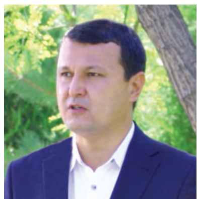
Қаҳрамон САРИЕВ, Қорақалпоғистон Республикаси Вазирлар Кенгаши раиси:

— Видеоселектор йиғилишида ўрмон хўжалигини ривожлантириш,