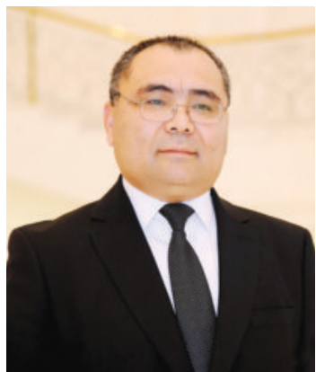
Иброҳим АБДУРАҲМОНОВ, инновацион ривожланиш вазири