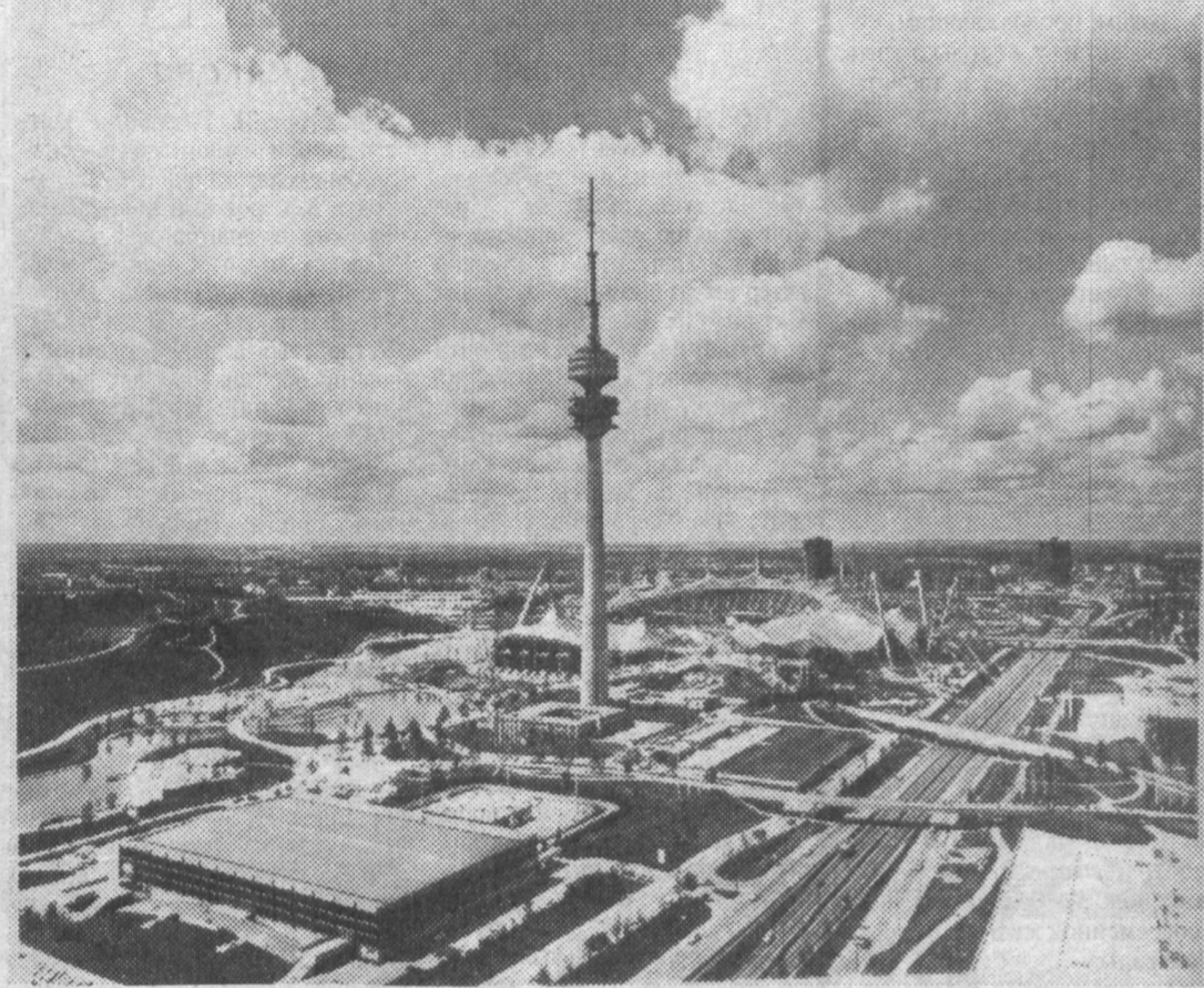
НА СНИМКЕ: Мюнхен. В центре - 290-метровая телевизионная башня и стадион на 80 тысяч мест.

жение высоких зданий - это не тот путь, по которому должна идти китайская архитектура. По их мнению, "высокие однотипные здания полностью отеснят чисто китайский орнамент и стиль в строительстве". Однако время показало, что при умелом использовании китайской специфики и традиций в строительстве возведенные небоскребы стали украшением не только Шанхая, но и Пекина, Гуанчжоу, Тяньцзиня и многих других. Кстати, южнокитайский Гуанчжоу занимает второе место по количеству высотных зданий, их здесь 19. А как же китайская столица? Пекину принадлежит лавры самого высокого небоскреба в Китае. Это торгово-коммерческий центр "Цзингуан", его высота достигает 208 метров.