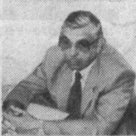
Ш. И. КАРИМОВ

Сообщение для прессы: в Министерстве здравоохранения Республики Узбекистан 3 мая в 11 часов утра состоится пресс-конференция, посвященная теннисному турниру "Хавас".