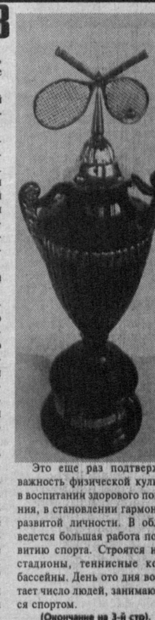
Это еще раз подтверждает важность физической культуры в воспитании здорового поколения, в становлении гармонично развитой личности.

Вскоре первый урожай персиков, гранатов, нинжра получат фермеры агрохозяйства имени Бабура. И нынче земледельцы в неурядях, пустующих адырах, на берегах каналов посеяли сорок тысяч плодородных деревьев.