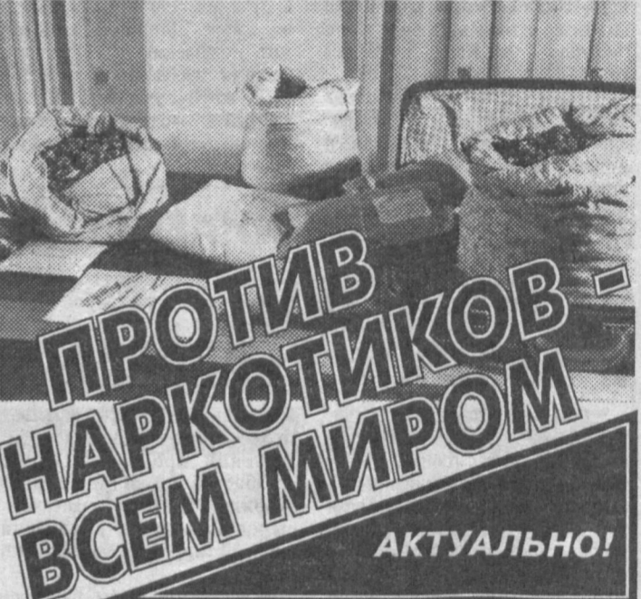
ПРОТИВ НАРКОТИКОВ ВСЕМ МИРОМ АКТУАЛЬНО!