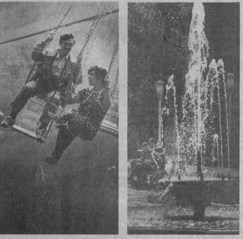
Пусть весеннее настроение не покинет больше вас...