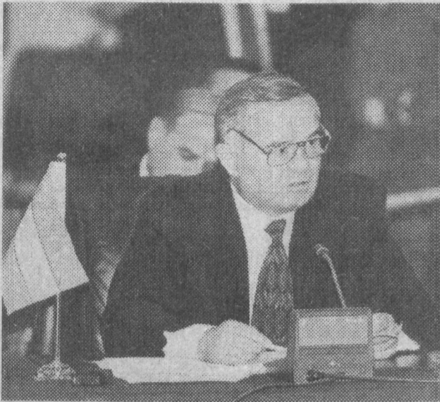
НА СНИМКАХ: выступление Президента Республики Узбекистан Ислама Каримова на IV встрече глав государств - членов ЭКО; в зале заседания.