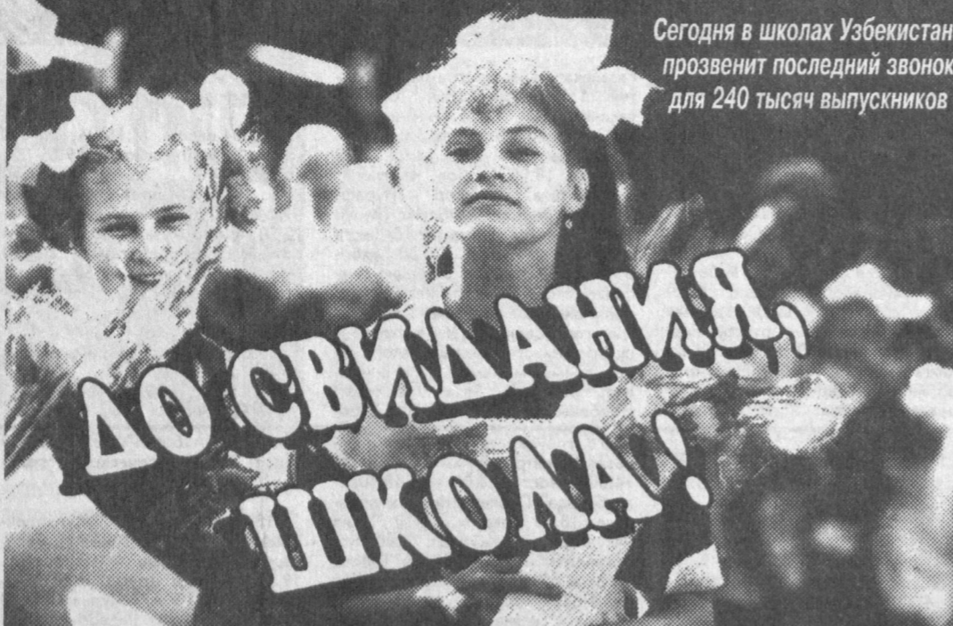
Сегодня в школах Узбекистана прозвонит последний звонок для 240 тысяч выпускников

РЫБЫ (20.02 - 20.03). Неудача в принципе неплоха. Однако не исключено ухудшение самочувствия в среду.