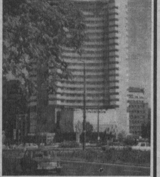
Информационное агентство "Жахон" при МИД Республики Узбекистан. На СНИМКЕ: отель "Интерконтиненталь" в центре Бухареста. Фото получено через Инфо-центр.

Этому будет способствовать соглашение о налаживании транспортных связей между странами, одним из вариантов которого станут транспортные артерии через порты Новороссийск, Поти и Батуми.