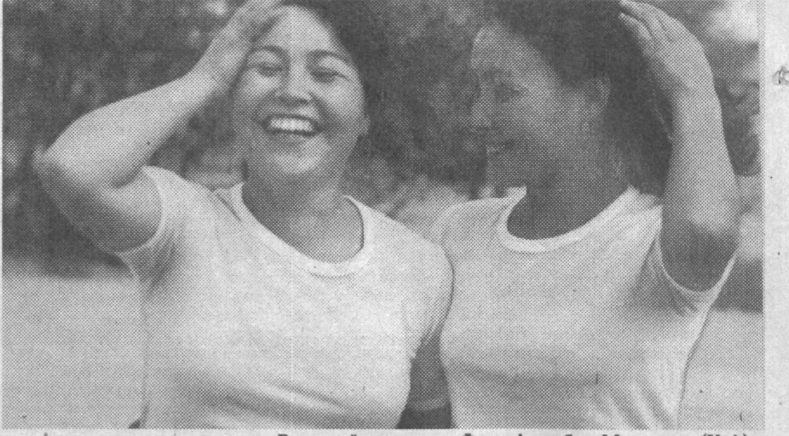
Вольный ветер...