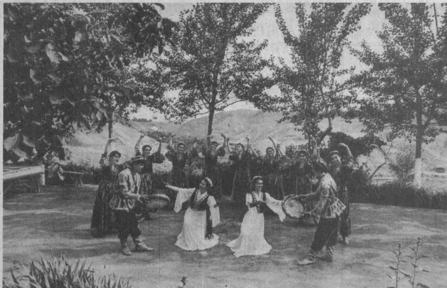
Художественный ансамбль Кувинского районного дома культуры "Анор" побывал во многих странах и показал миру узбекское искусство.