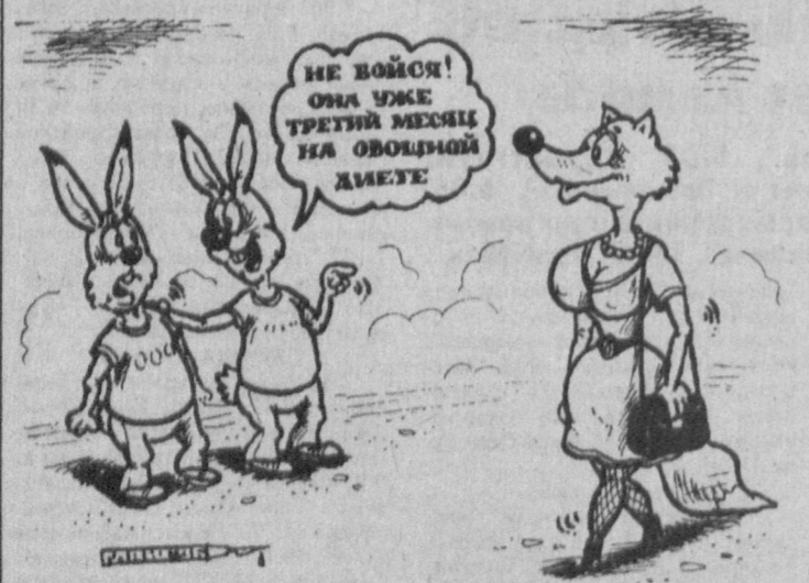
Рис. Александра Маркелова.

На третий день он приходит вновь и видит табличку: "Апельсин нет". - Ага! - удовлетворенно восклицает посетитель. - Значит, были все-таки апельсины! ... - Что-то опять в Париж захотелось... - А вы там уже были? - Нет, я туда уже хотел! ... Похороны Ротшильда. В погребальной процессии заливаются слезами скромно одетая женщина. - Вы так убиваетесь... Покойный, наверное, был вашим родственником? - Нет! Потому и плачу. ... - Мне сегодня приснилась твоя жена. - Да? И что она говорила? - Ничего. - Значит, это была не моя жена.