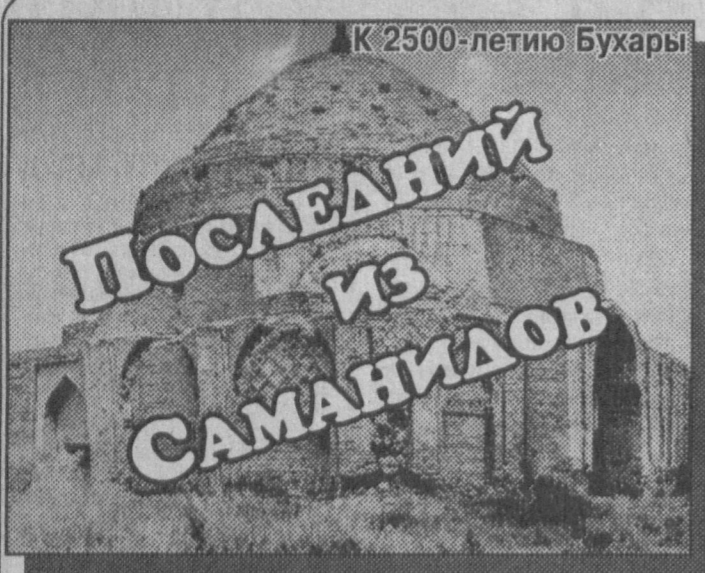
К 2500-летию Бухары

Недалеко от города Керки в туркменском селе Астана-баба стоит мавзолей Алаббердара (так называли полководцев, которые со временем в руках защищали свою родину). Построен он в XI веке на месте гибели последнего саманидского эмира аль-Мунтасира, вписавшего свою страну в 2500-летнюю историю Бухары.