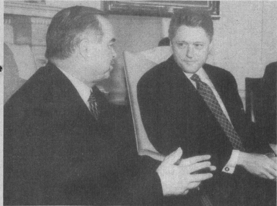
Вашингтон, 25 июня, Белый дом. Во время встречи Президента Республики Узбекистан Ислама Каримова и Президента США Билла Клинтон один на один.

Верховный Комиссар Бруней-Даруссалам в Делибритании - Дато Касим Дауд. Информационное агентство "Жахон".