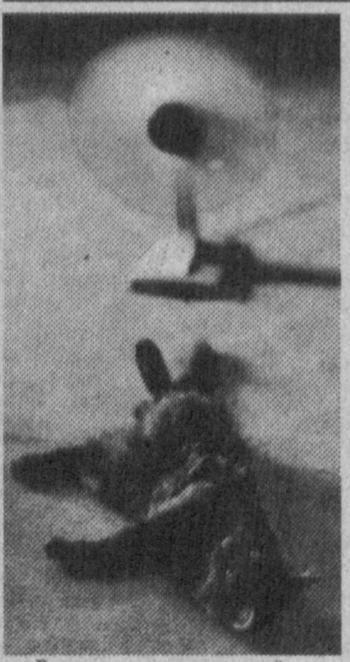
Савелий Львов.

РЫБЫ (20.02 - 20.03). Наконец, неожиданно на минувшей неделе вам удалось по-настоящему отдохнуть. Довольны все, особенно дети. И уже не торопятся с такой настойчивостью мысль об отпуске. Он зависит от обстоятельств, из которых вам в одиночку не выбраться. Вторник - самый подходящий день для переговоров с начальством на эту тему.