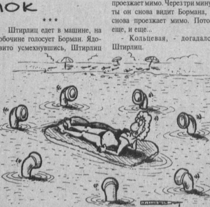
Рисунок Александра Маркелова.

На одной из станций метро к машинисту поезда подбегает человек с пистолетом: - Быстро поворачивай на Копенгаген. - Ты что, сляпый? - На Копенгаген, я сказал. - Опомнись, ненормальный, это же не самолет! - Стрелять буду! Раз! Два! - Граждане пассажиры, двери закрываются! Следующая станция - Копенгаген. *** Сталин посмотрел "Отелло". - А этот, как его, Яго? - неплотной организатор. *** В строительное управление приходит здоровенный детина: - Вам рабочие нужны? - Конечно. А что вы умеете