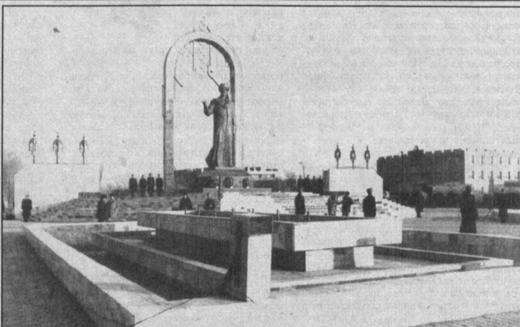
Накануне Нового года в Ургече был открыт памятник поэту Агахи.