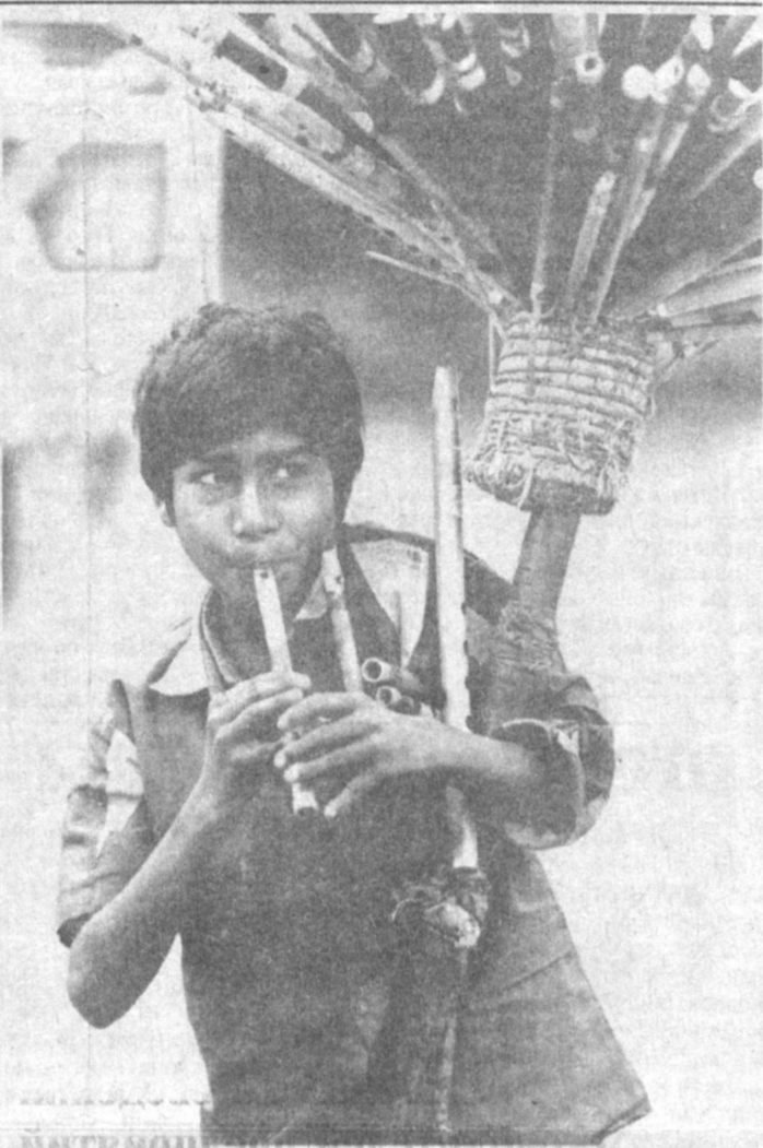
По странам мира. Индия, Юный уличный продавец музыкальных инструментов.

НАСА планирует запустить в 2003 году к спутнику Юпитера Европе новый космический аппарат.