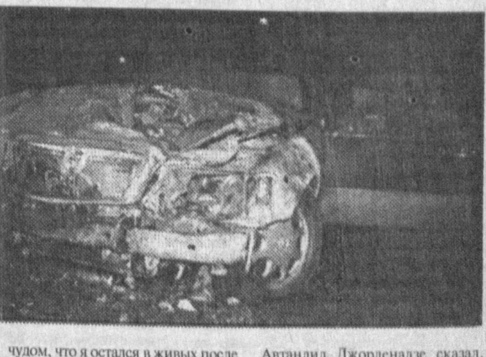
чуждом, что я остался в живых после двух покушений. Чужда произошла только по воле Всевышнего. Бог знает, что я не жажду усилий для блага моей страны".

"Это второе покушение является не только ударом по президенту, но и по Грузии. Можно считать